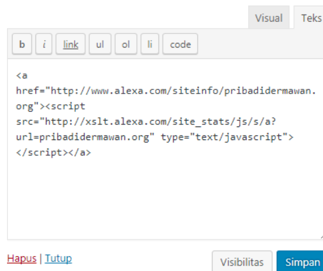
Gambar 3. Code Widget Alexa

Tampilan pada gambar 2 dapat diperoleh dari input code dengan menambahkan widget HTML yang di letakan di bagian footer website Pribadi Dermawan.