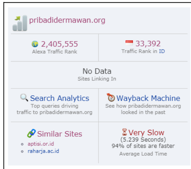
Gambar 5. Alexa Traffic Rank Pribadi Dermawan 22 September 2017

Pada gambar 5 menunjukkan bahwa ranking website Pribadi Dermawan pada tanggal 22 September 2017 dengan menggunakan alexa rank memperoleh peringkat 2.405.555 di dunia, dan mendapatkan peringkat 33.392 di Indonesia. Dapat diketahui melalui toolbar alexa rank bahwa peringkat website Pribadi Dermawan mengalami kenaikan yang signifikan selama 1 bulan.