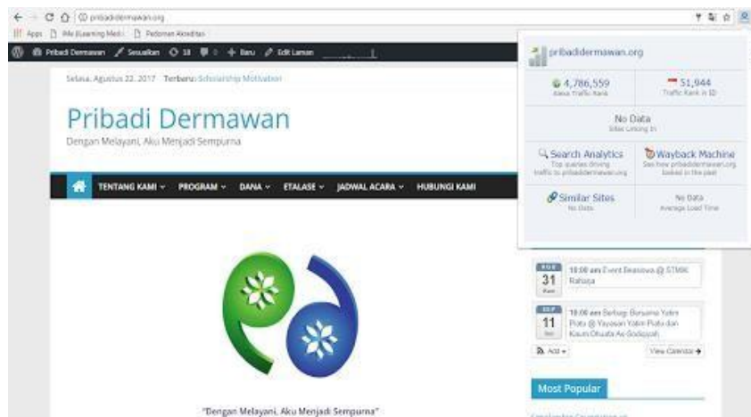
Gambar 4. Alexa Traffic Rank Pribadi Dermawan 22 Agustus 2017

Pada situs website crowdfunding salah satunya yaitu website Pribadi Dermawan, mendaftarkan situs ke alexa masih cukup baru dan aktivitas pada website Pribadi Dermawan terbilang masih sedikit sehingga peringkat yang di peroleh masih sangat besar bahkan terkadang naik-turun. Informasi mengenai traffic atau kunjungan dengan alexa berasal dari toolbar alexa yang dipasang pada browser yang digunakan. Dari toolbar tersebut kita dapat mengetahui ranking suatu blog atau website .