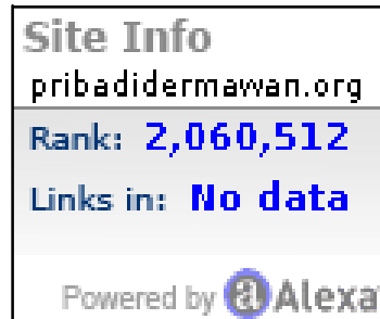
Gambar 2. Widget Alexa Rank

digunakan sebagai pengukur data oleh alexa.com. Dengan memasang widget alexa rank pada website, maka perhitungan akan lebih akurat.