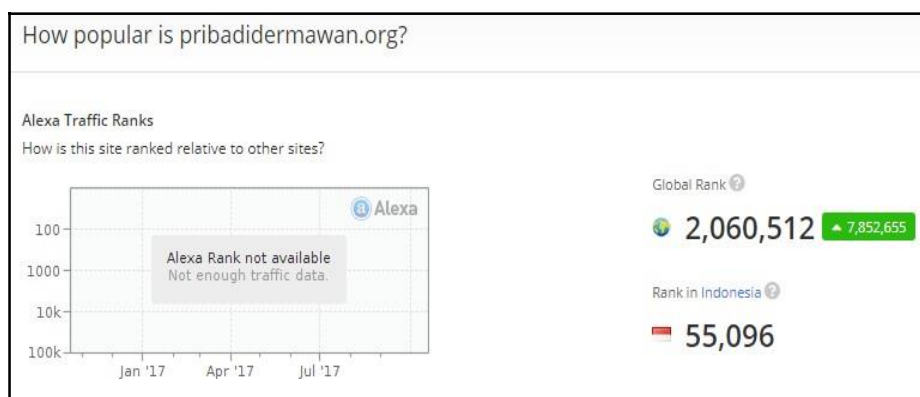
Gambar 6. Popularitas Website Pribadi Dermawan

Alexa rank indikator peringkat sebuah website berdasarkan trafik atau banyaknya pengunjung yang diberikan atau dibuat oleh alexa.com, data trafik tersebut diambil melalui toolbar alexa pada browser pengunjung website atau blog tersebut.