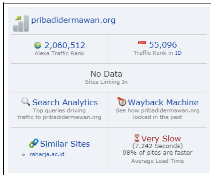
Gambar 6. Alexa Traffic Rank Pribadi Dermawan 21 Oktober 2017

Pada gambar 5 menunjukkan bahwa ranking website Pribadi Dermawan pada tanggal 22 September 2017 dengan menggunakan alexa rank memperoleh peringkat 2.405.555 di dunia, dan mendapatkan peringkat 33.392 di Indonesia. Dapat diketahui melalui toolbar alexa rank bahwa peringkat website Pribadi Dermawan mengalami kenaikan yang signifikan selama 1 bulan.