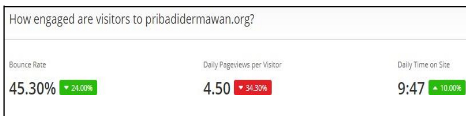
Gambar 7. Keterlibatan Pengunjung

Alexa rank dapat mengukur kualitas website melalui alexa.com yaitu website resmi dari Alexa Rank. Setelah di telusuri melalui website alexa.com, Alexa Rank akan menampilkan ranking dari website Pribadi Dermawan baik secara Global atau Negara (asal website ) yaitu Indonesia. Pada website pribadidermawan.org berada pada peringkat 2.060.512 di dunia, naik 345.043 peringkat dari 1 bulan sebelumnya, sedangkan di Indonesia sendiri berada pada peringkat 55.096.