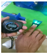
Gambar 3. Pengujian sensor sidik jari pagar

Pengujian sensor sidik jari untuk membuka pagar, pintu, dan jendela, yaitu dengan cara menempelkan jari yang sudah didaftarkan pada sensor sidik jari. Hasil percobaan akses untuk membuka pagar dapat dilihat pada tabel – 2, tabel – 3 dan tabel – 4 .