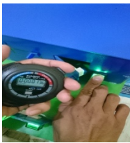
Gambar 4. Pengujian sensor sidik jari pintu rumah

hasil perancangan dan pengujian bisa diterapkan pada tiga akses, yaitu pagar, pintu, dan jendela, juga memberikan informasi jika ada orang lain yang masuk dengan tidak sesuai prosedur. Hasil perancangan dan pengujian sensor sidik jari pada rumah tinggal sebagai sistem keamanan berbasis Arduino, motor servo pada pagar, dan solenoid doorlock pada pintu dan jendela dapat bekerja ketika sensor sidik jari menerima sidik jari yang terdaftar,