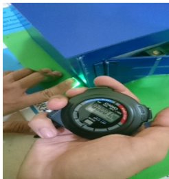
Gambar 5. Pengujian sensor sidik jari jendela

Dengan menggunakan sistem keamanan berbasis arduino yang diintegrasikan dengan sensor sidik jari, dan juga modifikasi dari penelitian sebelumnya maka sistem keamanan menjadi lebih optimal seperti tabel – 5: